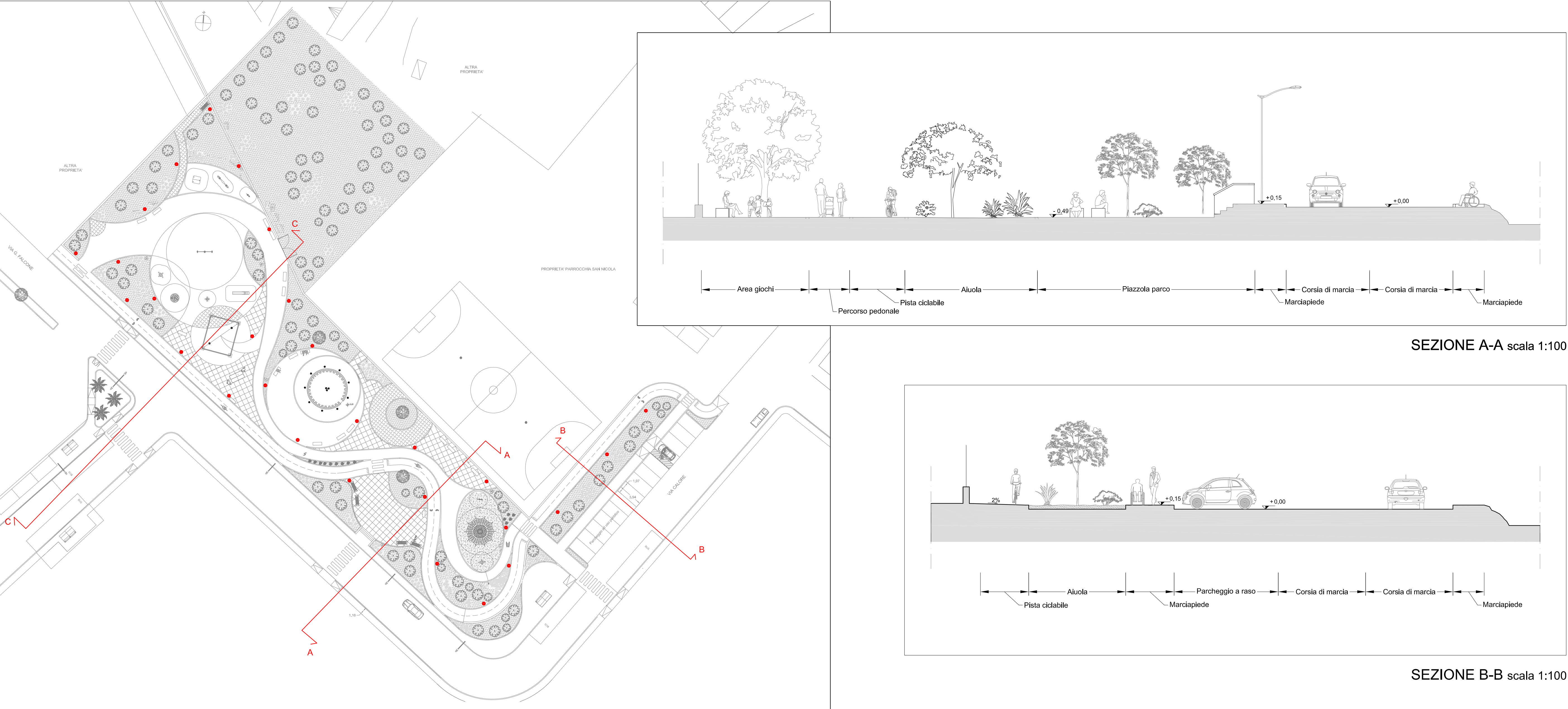
PLANIMETRIA DI RIFERIMENTO